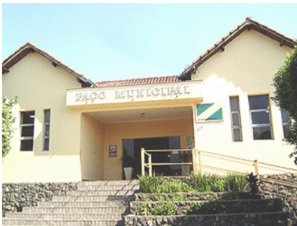
Prefeitura Municipal nos dias de hoje

Em 1939-1943, o Município de Glicério é composto dos Distritos de Glicério e Brauna, e pertence ao termo de Penápolis da comarca de Penápolis.